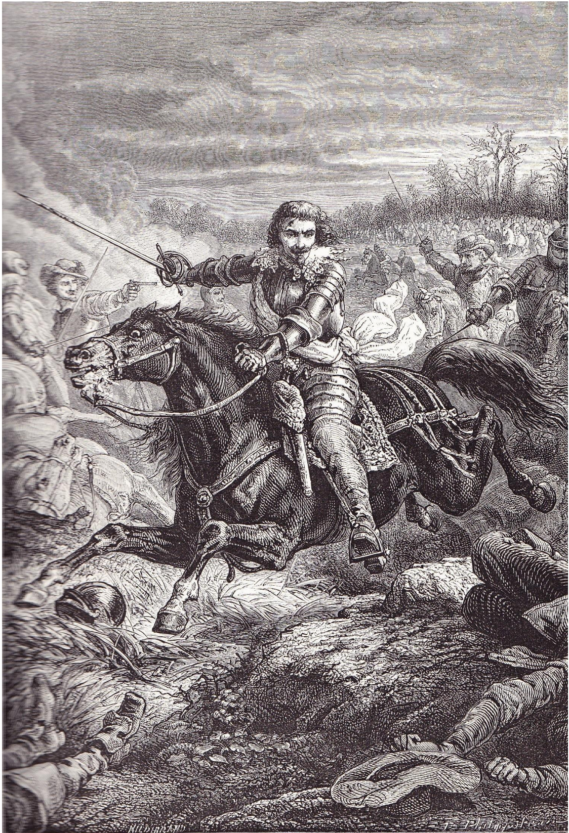
HENRI, DUC DE MONTMORENCY, A LA BATAILLE DE CASTELNAUDARY

« Henri, duc de Montmorency, à la bataille de Castelnaudary » (1 er septembre 1632)